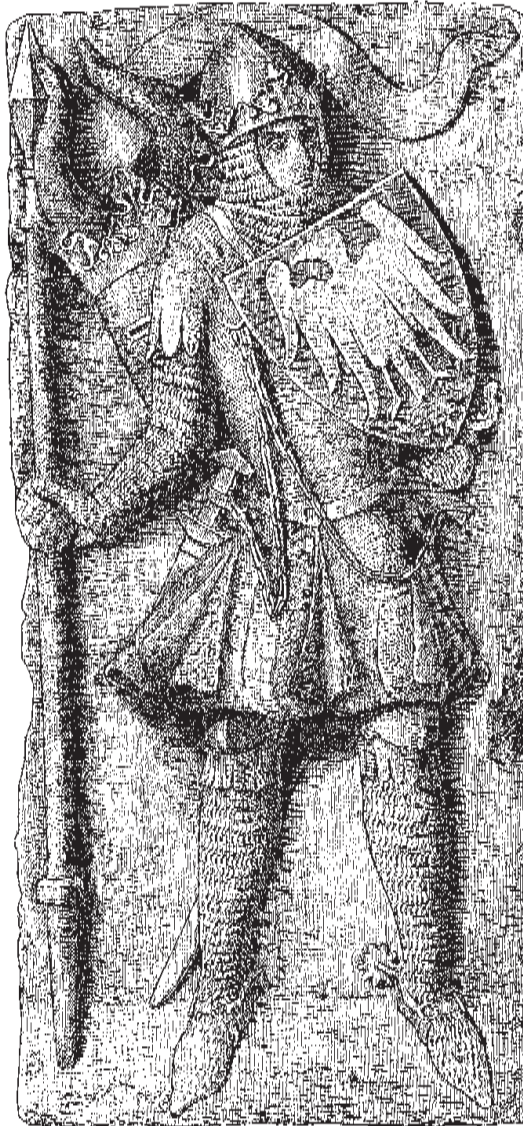
Швейцария. Битва при Моргартене. 1315 г.

Такое энергичное вмешательство демократического элемента в общий ход событий, противопоставленное элементу рыцарско-аристократическому, вызывает большой интерес к южно-германской войне, продолжавшейся безрезультатно 8 лет. Рыцарство и родовитые горожане были расположены в пользу Австрии. Приобретавшие силу городские элементы — цехи — стояли за Баварию. Города помогали королю Людовику, ссужая его кредитами и деньгами, в которых он нуждался. Впрочем, эта война, которая была причиной неурожая и длившейся три года дороговизны (1315—1318) вследствие опустошения края, была не очень кровопролитной благодаря малочисленности армий, а также вследствие того, что прерывалась на месяцы и даже годы из-за истощения средств у противников.