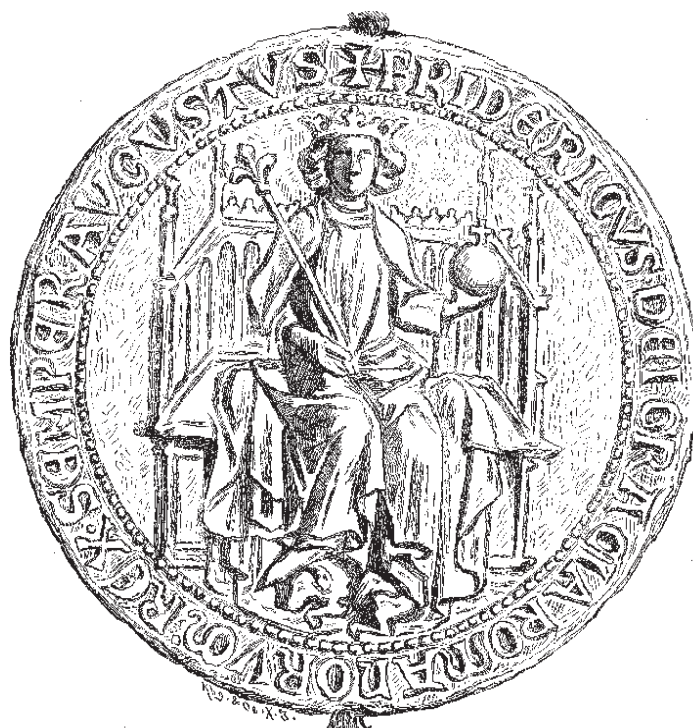
Королевская печать Фридриха Австрийского.

весьма сомнительное избрание. В Заксенхаузене меньшинство — Кельн, Пфальц, Саксония — провозгласило королем Фридриха, а большинство — Майнц, Трир, Бранденбург, Чехия — избрали Людовика. Фридриха короновал в Бонне архиепископ Кёльнский, Людовика — в Аахене архиепископ Майнцкий, следовательно — над первым был совершен обряд надлежащим лицом, но не в