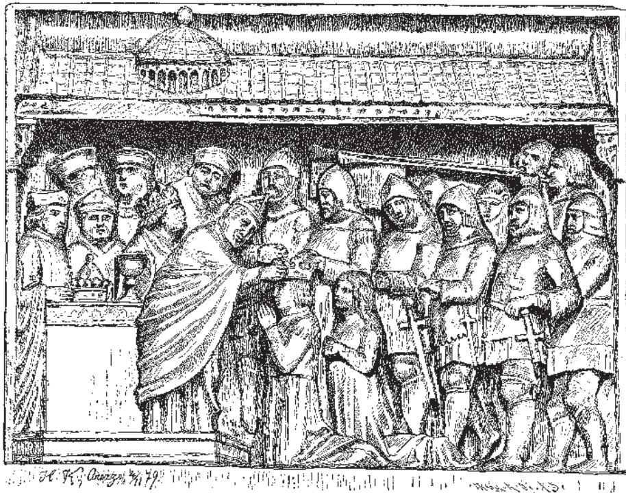
Коронация Людовика Баварского в соборе святого Петра в Риме. Ее производит Гвидо Тарлати ди Пьетрамале, епископ Ареццо. Рельеф с гробницы этого епископа в Ареццо.

обряд миропомазания. Такой успех, казалось, совершенно одурманил Людовика, разум которого не соответствовал возраставшим задачам его царствования. Называя папу лишь «Иаковом из Каора», как тот называл его только «герцогом Баварским», он прибег к какому-то воображаемому судебному пра-