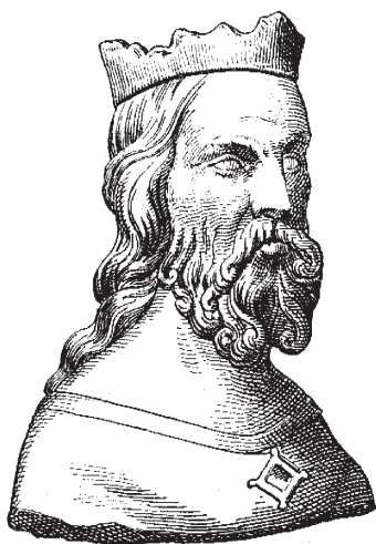
Ян Люксембургский, король Чехии (1310–1346). Бюст XIV в. Трифорий Пражского собора.

папой. Не могло быть и речи о завоевательном походе на Неаполь, задуманном Людовиком в союзе с сицилийским королем Федерико. В декабре 1329 г. император вернулся в Германию, не успев нигде основать ничего прочного, в то время как антипапа смиренно заявил в Авиньоне о своем отречении, а в следующем 1330 году после публичного покаяния в своей вине с выражением всяческого раскаяния снова был принят в церковное лоно. Однако императорский титул — единственная добыча, привезенная из итальянского похода, — был все же немаловажен, а смерть Фридриха, последовавшая в том же году,