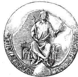
Печать Карла-Роберта, короля Венгрии (1308–1342). Париж. Национальный архив.

Положение Людовика. Съезд князей в Рензе.