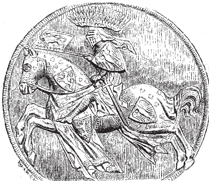
Ян Люксембургский, король Чехии, в полном вооружении. С печати Яна Люксембургского.

Безрассудство, с которым Людовик ради усиления власти своего дома присвоил себе права, принадлежащие исключительно церкви по религиозным и правовым понятиям того времени, снова настроило против него князей. Люксембургскому дому была нанесена тяжкая обида, а разрыв с папским престолом обострился, тем более что папой был, после смерти Бенедикта (1342 г.) Климент VI, друг Люксембургов. Людовик повернул назад: его императорская