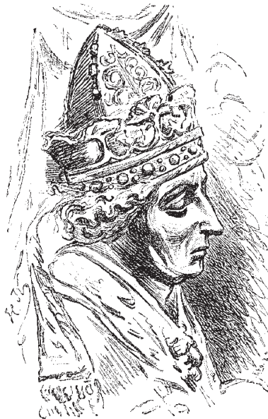
Голова статуи Людовика Баварского с его гробницы. Мюнхенский собор.