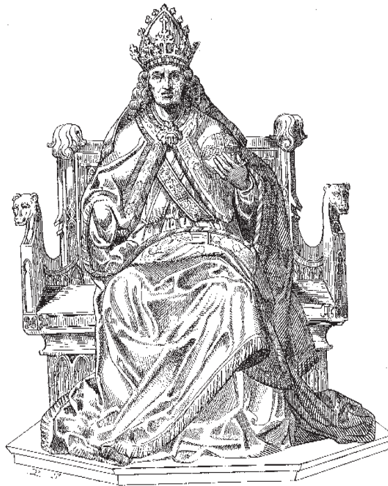
Людовик Баварский. Статуя сего гробницы, выполненная в 1470 г. Мюнхенский собор.

В числе других уступок папе — или, вернее, тому, кто властвовал над папой в данную минуту, французскому королю, — Карл давал обещание отдавать на решение папы все споры между Францией и Германией, как настоящие, так и будущие. Такое обязательство не тяготило его: подобные клятвы давались не с тем, чтобы их выполнять. Это избрание почти не пошатнуло положения Людовика: Карл, папский король, не мог даже добиться коронования. Город Аахен запер перед ним свои ворота; вообще, города стояли за Людовика, а это было основным в данную минуту. Несмотря на всю неустойчивость своей политики, Людовик выказывал свое расположение к горожанам и сделал для городского устройства больше, чем кто-либо из его предшественников. На городском