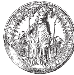
Печать Карла IV Французского (1321–1327).

Столкновение произошло уже в 1323 г. С той беззастенчивостью курьезной логики, которая оставалась незыблемой в течение веков, папа стал проводить мысль, что клятва, произносимая германскими государями при их