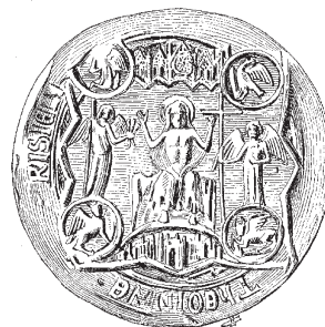
Печать факультета богословия Парижского университета. 1398 г. Париж. Национальный архив.

В это время в Чехии развилось движение, непосредственно примыкавшее к ереси Уиклифа. В Праге, отличавшейся умственным развитием, давно уже высказывались протесты, теперь же к ряду таких реформаторов, как Штитный, Милич, Матвей из Янова, примкнул молодой священник, степенный и высоко-нравственный искренний проповедник чех Ян Гус , родившийся в 1369 г. в пограничном местечке Гусинце. Он рано занял место при университете и, начиная с 1402 г., привлекал к себе общее внимание, состоя проповедником при Вифлеемской часовне в Праге и духовником королевы Софьи. Сочинения Уиклифа читались в Праге уже с 1381 г., еще при жизни автора. Университеты сохраняли тогда между собой живую связь, поддерживаемую постоянным наплывом и перекочевкой учащихся. Дух этих сочинений и практическая сторона учения Уиклифа вызвали сочувствие прямодушного Гуса. Он