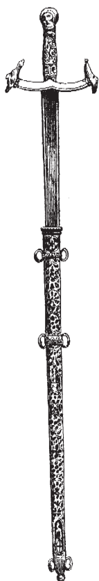
Курфюрст Фридрих I Бранденбургский.

обращение своих соседей-язычников в христианство. Их крестовые походы в эти области были для них только своего рода рыцарской потехой и предпринимались обычно лишь с прибытием какого-нибудь важного гостя с воинственной свитой, являвшегося для выполнения крестового обета, принятого им на себя ради моды или из стремления к рыцарским похождениям. Подобная борьба с язычеством была безуспешной, можно сказать, даже бессцельной,