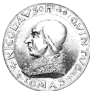
Медаль папы Николая V (1447–1455). Работа Андреа Гваццалотти. Париж. Нумизматический кабинет.

соборов. Евгений согласился на эти требования с обычными оговорками и незадолго до своей смерти отменил это согласие в тайном заявлении. Его преемник Николай V также был мастером на всякие уловки, на полусоглашения, столь удобные для поселения раздора между противными сторонами. Конечным результатом этого был обсужденный на рейхстаге в Ашаффенбурге в 1447 г. и заключенный в Вене в феврале 1448 г. конкордат, восстанавливающий все прежние порядки: император лишил Базельский собор руководящей роли, папа Феликс вступил в соглашение с Николаем V, и то, что оставалось от собора, с 1448 г. перенесенного в Лозанну, совсем рассеялось в 1449 г.