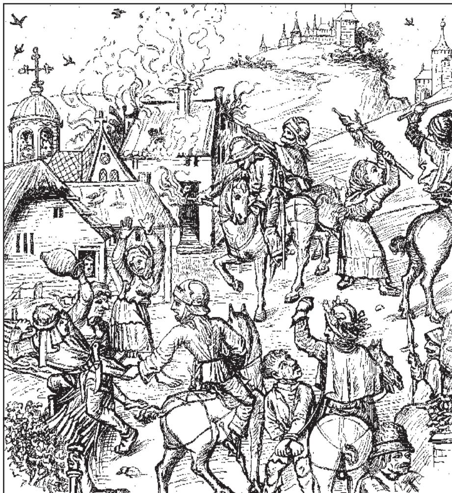
Разграбление села во время гуситских войн. Из лицевой рукописи XV в. Нюрнберг. Германский музей.

привели. Пятый крестовый поход под предводительством бранденбургского курфюрста Фридриха (1431 г.) закончился еще плачевнее прежних. При Домажлице войска стали обращаться в бегство, едва заслышав грохот военного обоза гуситов и звуки их боевой песни. Кардинал Джулиано Чезарини, сопровождавший войско, оставил даже свою шляпу в руках неприятеля, захватившего огромную добычу.