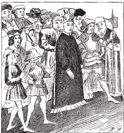
Ян Гус идет на казнь. Миниатюра из хроники Ульриха фон Рихенталя, написанной в 1417 г. Констанц. Национальная библиотека.