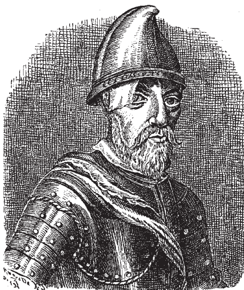
Ян Жижка. Со старинной гравюры.

который соединял в себе религиозный фанатизм и ясность ума настоящего военачальника и к тому же пользовался безграничным авторитетом. Это позволило ему даже после того, как он совершенно ослеп, удержать победу за гуситами. Нашествие немцев только подстрекало религиозный и национальный фанатизм чехов. В стране против всего, что не примыкало к ним, свирепствовали табориты. Они требовали уничтожения всех городов за исключением истинно правоверных, всех книг, кроме Библии, и каждый истинно верующий должен был преследовать всякое уклонение от исповедуемого им закона. Поход 1421 г. был для имперцев тоже неудачным и закончился их отступлением. В январе 1422 г. Жижка нанес им новое поражение. Он научился военному делу, участвуя в качестве польского наемника в битве под Танненбергом 1 , столь роковой для Тевтонского ордена. Жижка прожил достаточно долго для того, чтобы дисциплинировать свое войско и научить его полезным тактическим приемам. Оружием толпы служили цепи с железной оковкой; телеги, на которых ехали