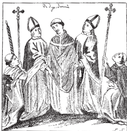
Осуждение Яна Гуса. Миниатюра из хроники Ульриха фон Рихенталя, написанной в 1417 г. Констанц. Национальная библиотека.

ногого, не обладавшего выдающимся умом, но честного и набожного человека. Большинство членов собора не желало смерти Гуса, как это часто утверждают протестантские историки. Он должен был лишь отречься, т. е. покориться власти церкви и, со своей точки зрения, бывшей и точкой зрения