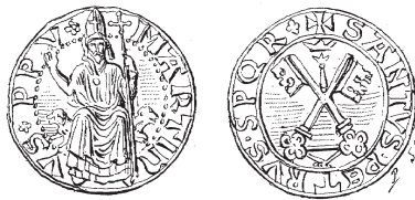
Монета папы Мартина V (1417–1431). Париж. Нумизматический кабинет.

исполнении церковного приговора, хотя Сигизмунд и подумывал о вмешательстве в дело. Но богословы нашли лазейку в том, что необязательно держать слово перед тем, кто сам изменяет своему слову перед Богом. Гус принял смерть на костре — обычный вид казни за преступления, вымышленные фанатизмом, с твердостью ученика Христа и мученика за великий принцип (6 июля 1415 г.). В следующем году той же смертью погиб Иероним, также привезенный в Констанц. В минуту слабости он отрекся, но вскоре снова воспрял духом и взял назад свое отречение. Собору вскоре пришлось