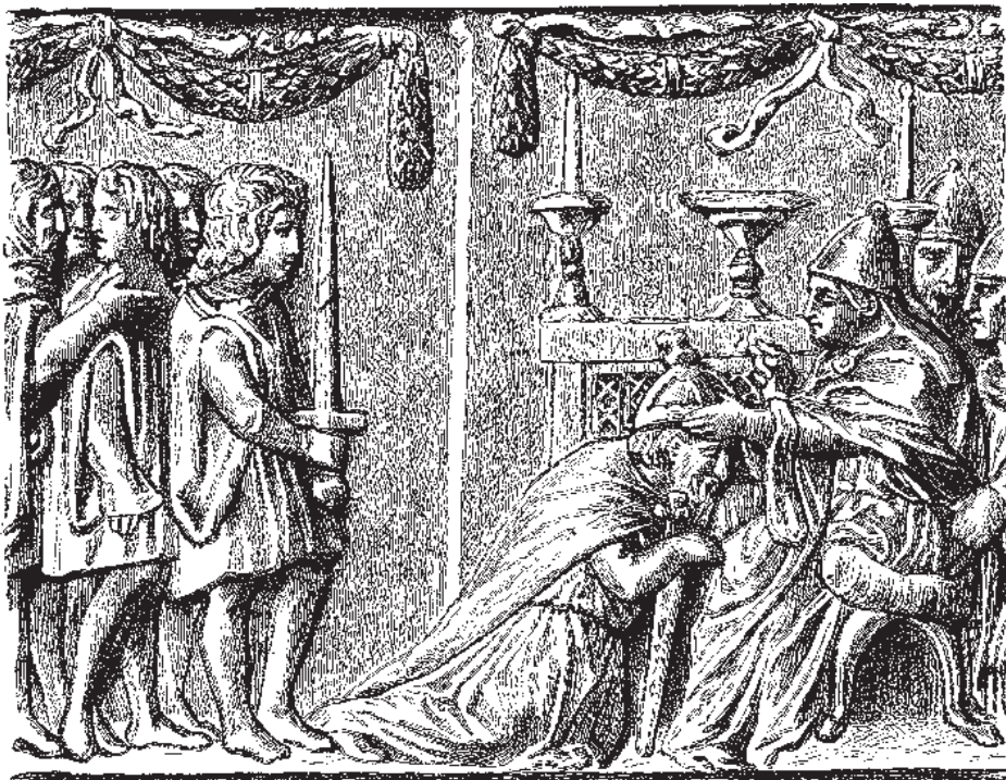
Коронация императора Сигизмунда папой Евгением IV. Бронзовый рельеф на воротах собора святого Петра в Риме.

Выполнены в 1447 г. Антонио Филарете и Симоне Донателло по заказу Евгения IV.