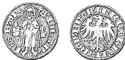
Золотой гульден (флорин) Фридриха I Гогенцоллерна, маркграфа Бранденбургского (он же Фридрих V, бургграф Нюрнбергский).

Саксония — другое курфюршество, которое переменяло династию при Сигизмунде. Последний из Виттенбергов умер в 1420 г., не оставив потомства. Глава государства передал власть маркграфу Майсенскому Фридриху Строптивому из дома Веттинов, которому он был обязан за помощь, в том числе денежную, во время гуситских войн.