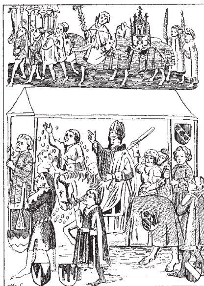
Констанц- ский со- бор.